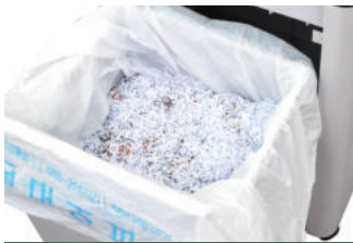
규격:소형 | 크기:650X550mm